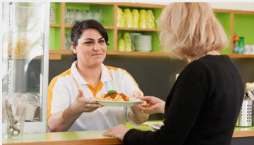
Gewohnte Qualität gibt es in der Kantine der Dachauer Straße.